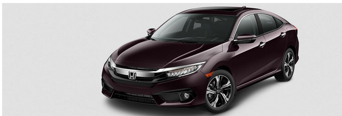
Honda Civic Touring 1.5 Turbo; foto meramente ilustrativa

Quem fizer um hole-in-one no buraco 6 do Damha Golf Club, durante o 68º Aberto do Estado de São Paulo, de sexta-feira a domingo desta semana, 11 a 13 de agosto, irá ganhar um Civic Touring 1.5 Turbo, no valor de R$ 125 mil.