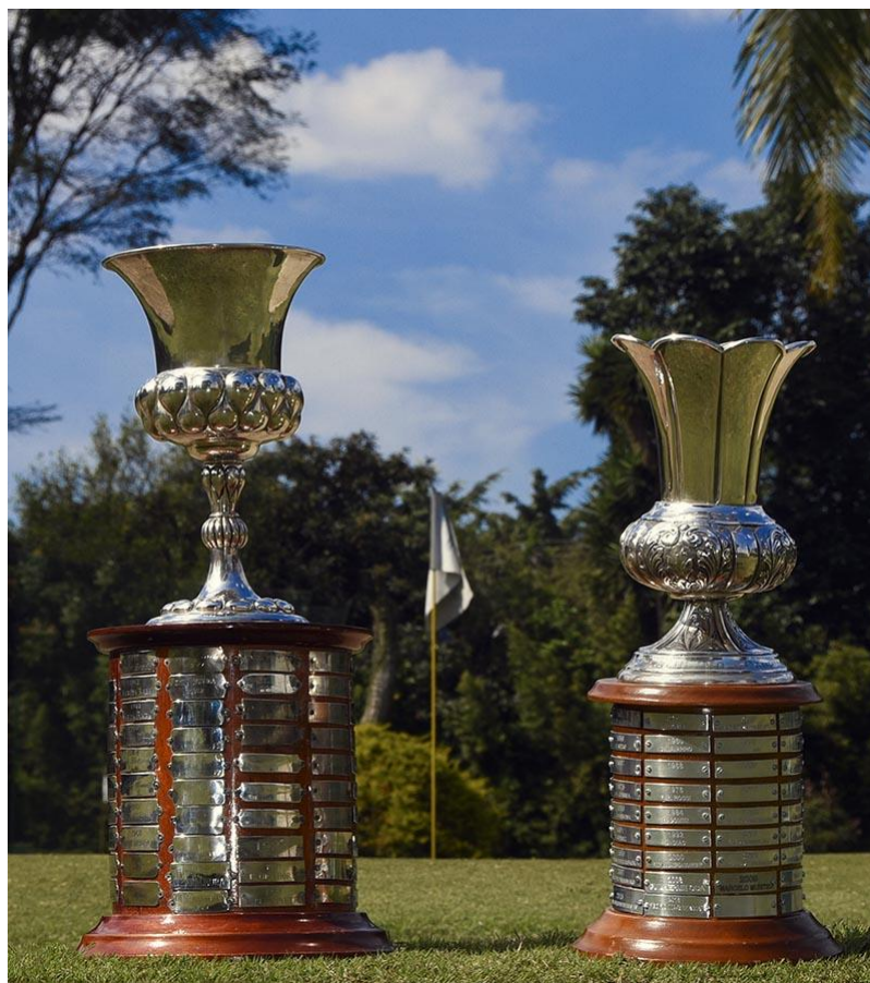
Troféus feminino (esq.) e masculino (dir.) de posse transitória do Aberto do Estado de São Paulo

Golfe e do Damha Golf Club. Os resultados estarão disponíveis no Sisgolfe, da FPG, e no Blue Golf, disponibilizado pela CBG.